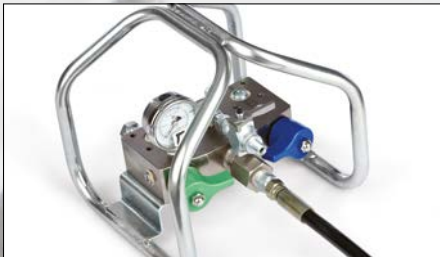
Uzaktan Karışım Manifoldu

Yeni dozajlama teknolojisi sayesinde malzeme karıştırma yeni bir hassasiyet seviyesine ulaştı. Graco XM ile yardımcı komponent (veya B tarafındaki malzeme) yüksek bir basınçla ana malzemeye (A tarafı) enjekte edilir. Gelişmiş sensörler, pompaların daha çok verim ve daha az israfta hassas ve doğru karışım için basınç değişikliklerini dengelemesini sağlar.